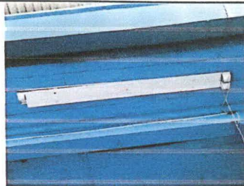
Foto 4. Cambio de lamparas en mal estado a focos