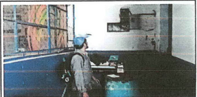
Foto 6. colocacion de interruptores sobre puestos con canaleta para proteccion del cable

Observación: Si es necesario se pueden agregar hojas adicionales y actualizar el número de hojas.