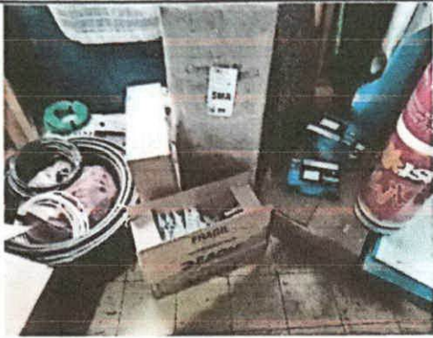
Foto 1. Ingreso de Materiales nuevos de Electricidad