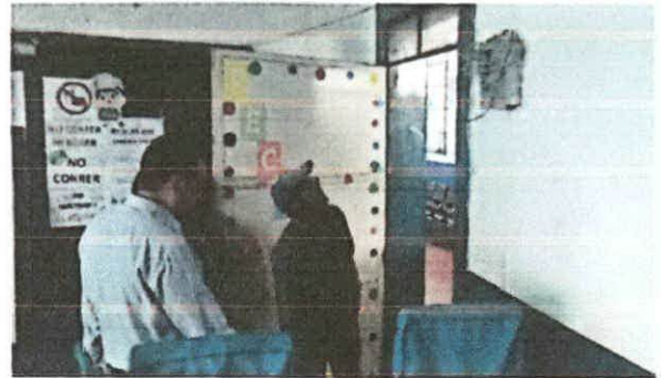
Foto 2. Revisión de caja flipones computacion