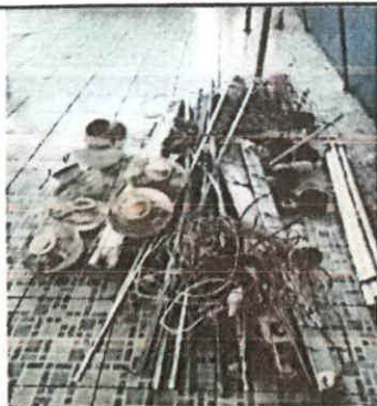
Foto 5. cambio de cableado antiguo interno en mal estado